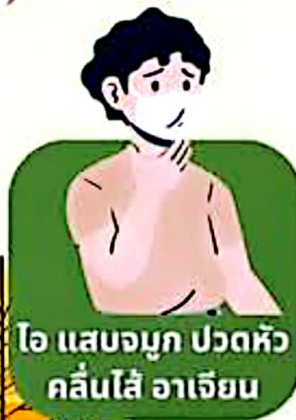
ไอ แสบจุก ปวดหัว คลื่นไส้ อาเจียน