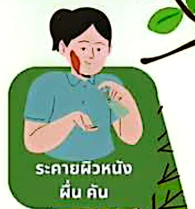
ระคายผิวหนัง ผื่น คัน

หากมีอาการผิดปกติจากฝุ่น PM2.5 สามารถขอรับคำปรึกษาได้ที่โรงพยาบาลทุกแห่ง