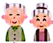
ผู้สูงอายุ