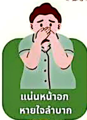
แน่นหน้าอก หายใจลำบาก