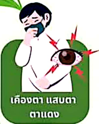
เคืองตา แสบตา ตาแดง